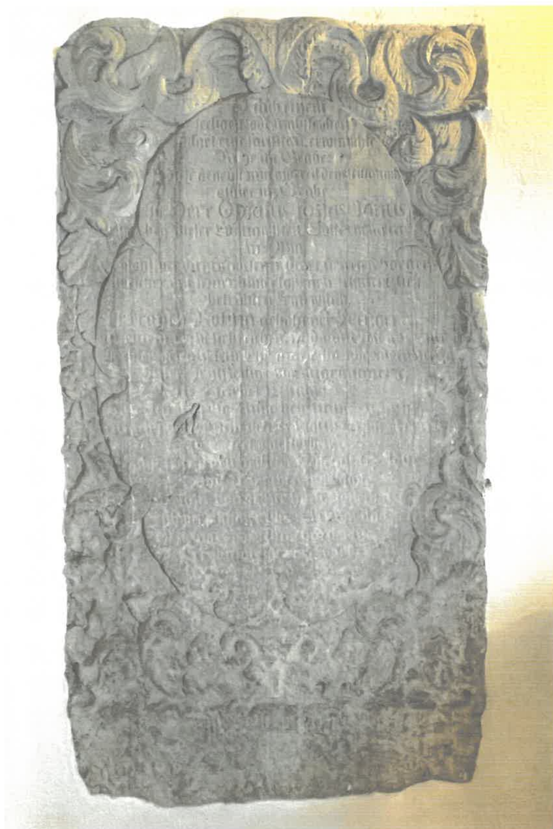
Fot. 8. Epitafium inskrypcyjne Opatusa Josiasa Janusa Oberg a z roku 1725 r. w kościele pw. Chrystusa Króla w Osieku. Widoczny stan zachowania. Stan z 2023 roku.