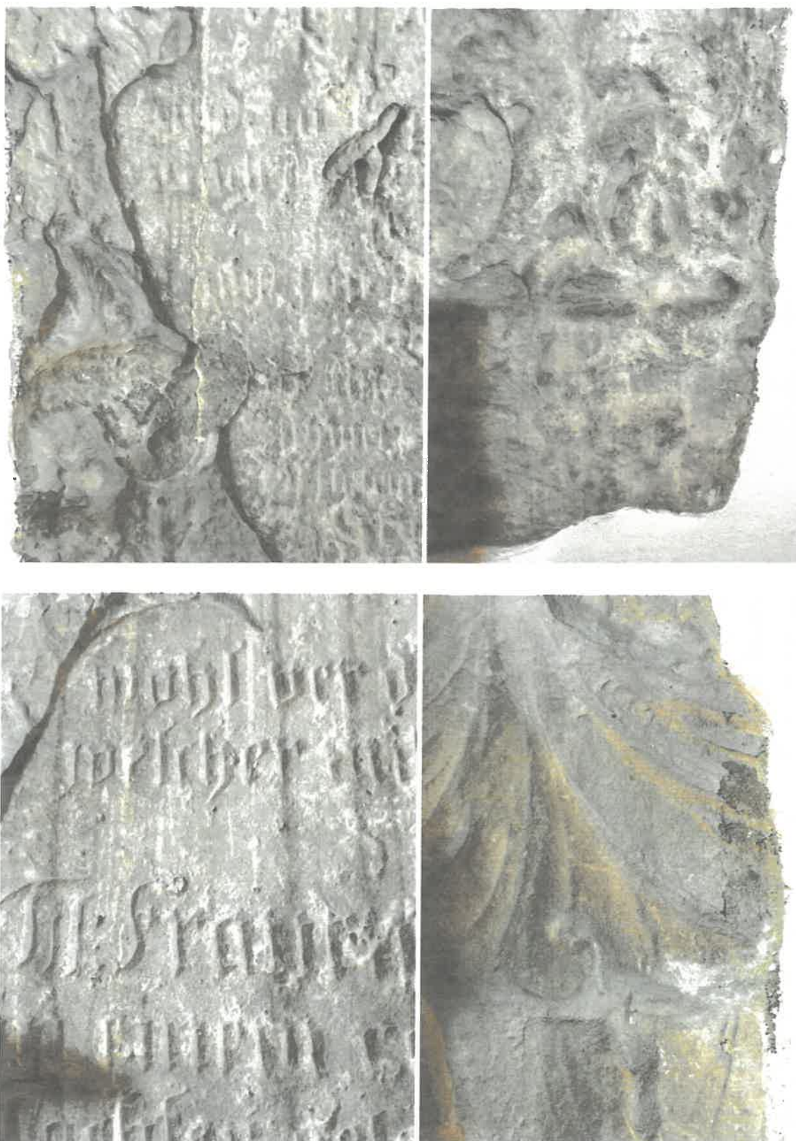
Fot. 12, 13, 14 i 15. Detal z płyty epitafijnej Josiаса Janusa Obergа z roku 1725 roku, kościół pw. Chrystusa Króla w Osieku. Widoczne wypłukanie formy rzeźbiarskiej. Stan z 2023 roku.

Parafia Rzymsko-Katolicka p.w. Chrystusa Króla Osiek, ul. Św. Katarzyny 73 59-300 Lubin, tel. +48 511 476 570 NIP 692-22-42-312, REGON 04011837 95 1600 1156 1844 3992 9000 0001