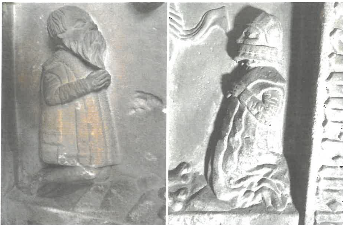
Fot. 2 i 3. Grupa Ukrzyżowania, płyta epitafijna z 1553 r., Kościół pw. Chrystusa Króla w Osieku. Detal, widoczne zanieczyszczenia powierzchni, wykwyty solne, ubytki formy.