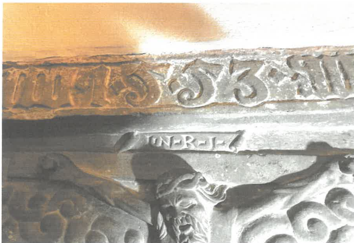
Fot. 4. Epitafium Nickla Von Schwenkfelda i jego żony ze sceną adoracji Chrystusa Ukrzyżowanego, 1553 r., kościół pw. Chrystusa Króla w Osieku. Widoczne zanieczyszczenia powierzchni wtórnymi farbami wapiennymi. Stan z 2023 roku.