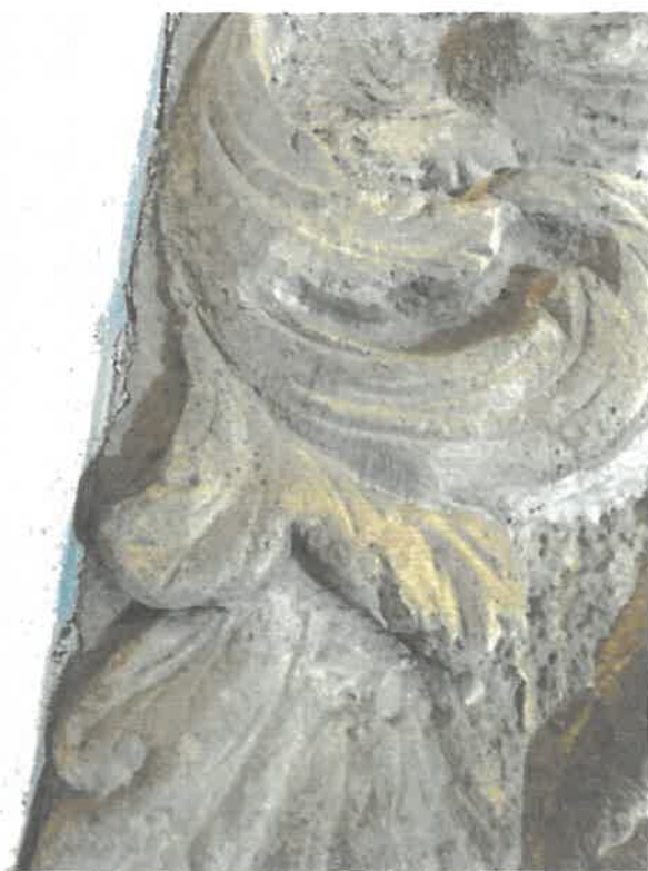
Fot. 10 i 11. Detal z płyty epitafijnej Josiasa Janusa Oberga z roku 1725 roku, kościół pw. Chrystusa Króla w Osieku. Widoczne wypłukanie formy rzeźbiarskiej. Stan z 2023 roku.