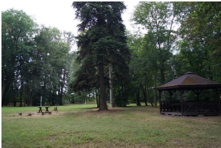
Park w zespole podworskim w Miłoradzicach z altaną, stan obecny – lipiec 2024 r.

romantyzmu — tu znakomitym przykładem będą oparte o układ wodny parki przy rezydencjach w Zimnej Wodzie, Liścu i Składowicach oraz przykłady parków krajobrazowych — m.in. w Krzeczynie Wielkim, Księginicach, Niemstowie, Czerńcu i Miłoradzicach.