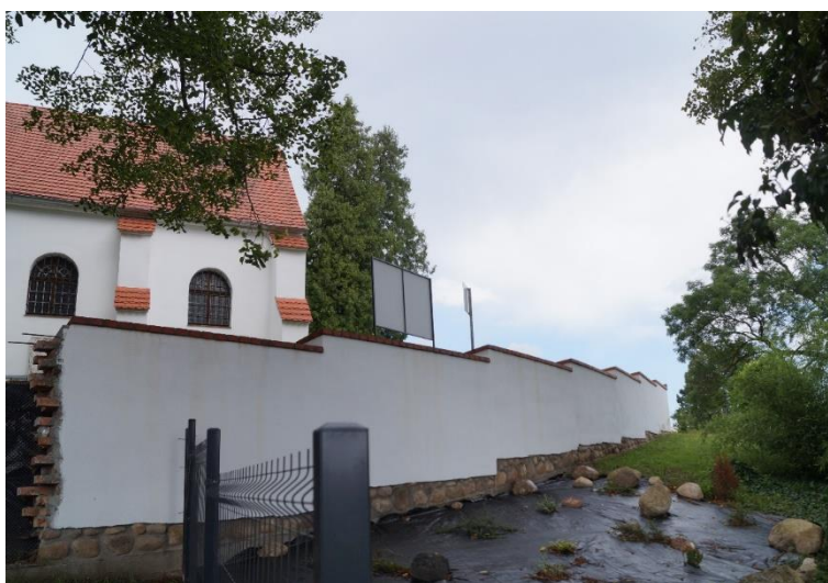
Mur cmentarza przy parafialnym kościele prawosławnym pw. Zaśnięcia Przenajświętszej Bogarodzicy w Zimnej Wodzie, stan obecny – lipiec 2024 r.

Obecnie kontynuowane są także prace przy remoncie muru cmentarnego przy kościele prawosławnym pw. Zaśnięcia Przenajświętszej Bogarodzicy w Zimnej Wodzie, na jego południowo-wschodnim odcinku.