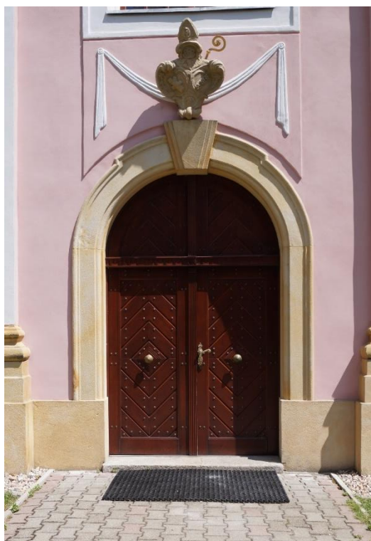
Rzymskokatolicki kościół parafialny pw. Trójcy Świętej w Zimnej Wodzie, portal po przeprowadzonych pracach konserwatorskich, stan obecny – lipiec 2024 r.