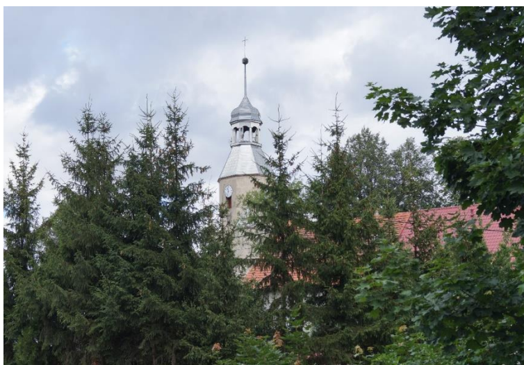
Widok na wyremontowany hełm wieży rzymskokatolickiego kościoła parafialnego pw. Świętej Trójcy w Miłoradzicach, stan obecny – czerwiec 2024 r.

Z udziałem finansowym Gminy prowadzone są również remonty elewacji kościołów. W latach 2020-2022 w katolickim kościele pw. Trójcy Świętej w Zimnej Wodzie przeprowadzony został kompleksowy remont elewacji oraz dachu. Prace obejmowały również konserwację kamiennych detali architektonicznych. Zakończony został także remont elewacji kościoła w Chrótniku.