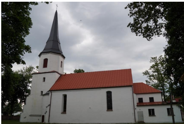
Rzymskokatolicki kościół filialny pw. św. Antoniego w Oborze, z odtworzonym hełmem wieży, stan obecny – maj 2024 r.