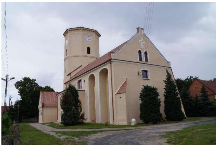
Rzymskokatolicki kościół parafialny pw. Matki Bożej Bolesnej w Chróstniku, po remoncie elewacji, stan obecny – lipiec 2024 r.

Obecnie kontynuowane są także prace przy remoncie muru cmentarnego przy kościele prawosławnym pw. Zaśnięcia Przenajświętszej Bogarodzicy w Zimnej Wodzie, na jego południowo-wschodnim odcinku.