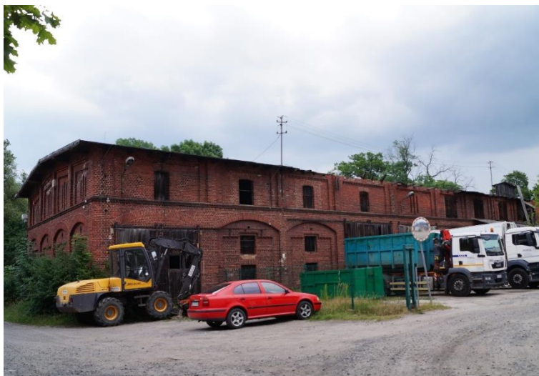
Księginice, stodoła na południowym podwórzku folwarcznym w zespole pałacowo-parkowym, stan obecny – maj 2024 r.

Niektóre obiekty zabytkowe z terenu Gminy: pałac w Raszówce, ruina pałacu oraz część parku w Siedlcach, parki w Czerńcu, Ustroniu, części parku w Gorzelinie i w Księginicach są zarządzane przez Krajowy Ośrodek Wsparcia Rolnictwa Oddział Terenowy we Wrocławiu. Potencjalnie mogą stanowić ofertę inwestycyjną.