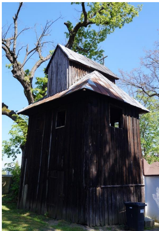
Dzwonnica w zespole rzymskokatolickiego kościoła parafialnego pw. św. Michała Archaniola w Siedlcach, stan obecny – maj 2024.

W ocenie aktualnego stanu prawnego ochrony zabytków sakralnych należy zwrócić uwagę, że dotychczasowe wpisy do rejestru zabytków cmentarzy nie precyzują, czy wpisem objęte są również okalające zabytkowe cmentarze kamienne mury (powstałe od średniowiecza i epoki nowożytnej) oraz okazałe nieraz ogrodzenia. Ponadto decyzja o wpisie do rejestru zabytków kościoła prawosławnego pw. Zaśnięcia Przenajświętszej Bogarodzicy w Zimnej Wodzie wymaga doprecyzowania, czy wpisany jest obiekt w granicach murów obwodowych czy wraz z działką nr 67. Z inicjatywy i ze środków Gminy Lubin w 2017 r. opracowano 6 tablic informacyjnych dla sakralnych zabytków Gminy: kościołów rzymskokatolickich w Chróstrniku, Osieku, Siedlcach, Szklarach Górnych, Zimnej Wodzie oraz dla cerkwi w Zimnej Wodzie.