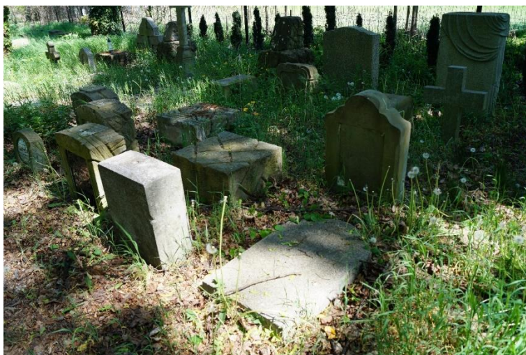
Cmentarz komunalny w Osieku, obecnie teren zagospodarowany parkowo – lapidarium, stan obecny – czerwiec 2024 r.

Zagospodarowanie zabytkowego terenu pocmentarnego w Osieku w kierunku parkowym. Zadanie prowadzone było w latach 2019-2020 i zostało dofinansowane przez Fundację KGHM – Polska Miedź. Przeprowadzono następujące prace: inwentaryzację dendrologiczną, roboty ziemne, ekshumacje i likwidację grobów, odtworzenie historycznego układu zieleni i alejek spacerowych, urządzenie lapidarium dawnych nagrobków, zagospodarowanie terenu i ustawienie ławek oraz elementów małej architektury, remont ogrodzenia z bramami oraz wykonanie odcinków nowego ogrodzenia i ustawienie tablicy informacyjnej. Koszt przedsięwzięcia wyniósł 420 660,00 zł, w tym kwota dofinansowania: 50 000,00 zł. Na terenie cmentarza prowadzone są bieżące prace porządkowe.