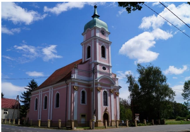
Rzymskokatolicki kościół parafialny pw. Trójcy Świętej w Zimnej Wodzie, po kompleksowym remoncie elewacji i dachu, stan obecny – maj 2024 r.