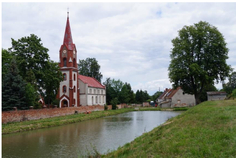
Raszowa, fosa w zespole pałacowo-parkowym, stan obecny – lipiec 2024 r.

W 2023 r. wśród wniosków złożonych przez Gminę Lubin w ramach Rządowego Programu Odbudowy Zabytków przygotowany został wniosek na dofinansowanie zadania własnego pn.: Prace remontowo- konserwatorskie mostu wschodniego na fosie w zabytkowym parku w Raszowej. Realizacja zadania przewidziana jest na 2024 rok. Stan zachowania mostu jest obecnie bardzo zły. Most został wyłączony z użytkowania.