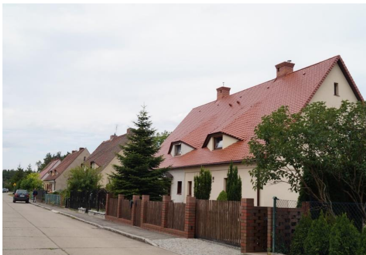
Raszówka, zabudowa osiedlowa przy ul. Odzyskanej, stan obecny – czerwiec 2024 r.

W krajobrazie kulturowym miejscowości istotną rolę pełnią zachowane w publicznej przestrzeni kapliczki, pomniki i ich relikty, słupy milowe czy krzyże pokutne. Ich zasób na obszarze Gminy Lubin jest słabo rozpoznany. Wiedza o tych zabytkach jest rozproszona, informacje odnaleźć można m.in. w monografiach miejscowości Gminy, a także na powszechnie dostępnych stronach internetowych ( dolny-slask.org.pl oraz lueben-damals.de ). Istnieje potrzeba ich dokładniejszego rozpoznania i udokumentowania, a także zapobieżenia dewastacjom.