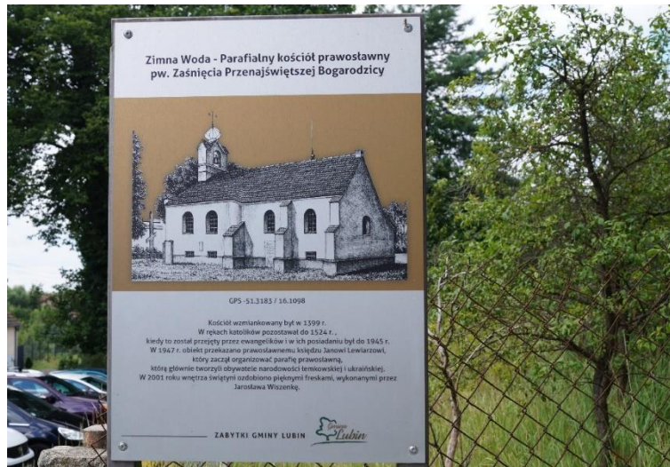
Tablica informacyjna przy parafialnym kościele prawosławnym pw. Zaśnięcia Przenajświętszej Bogarodzicy w Zimnej Wodzie

Na terenie Gminy Lubin dostępne są dla mieszkańców i turystów gry terenowe związane z zabytkami oraz historycznymi miejscami miejscowości Gminy [ https://ug.lubin.pl/gry-terenowe/ ]: