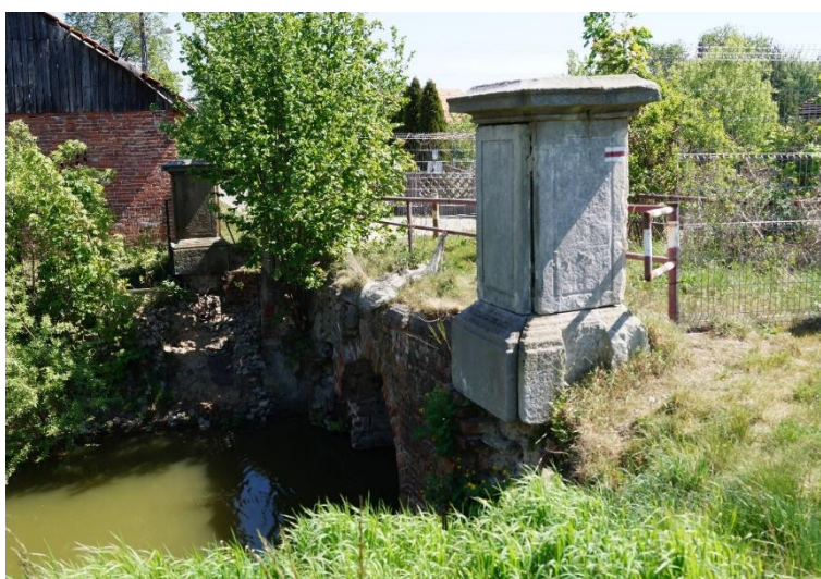
Raszowa, most wschodni w zespole pałacowo-parkowym, stan obecny – czerwiec 2024.

W 2023 r. wśród wniosków złożonych przez Gminę Lubin w ramach Rządowego Programu Odbudowy Zabytków przygotowany został wniosek na dofinansowanie zadania własnego pn.: Prace remontowo- konserwatorskie mostu wschodniego na fosie w zabytkowym parku w Raszowej. Realizacja zadania przewidziana jest na 2024 rok. Stan zachowania mostu jest obecnie bardzo zły. Most został wyłączony z użytkowania.