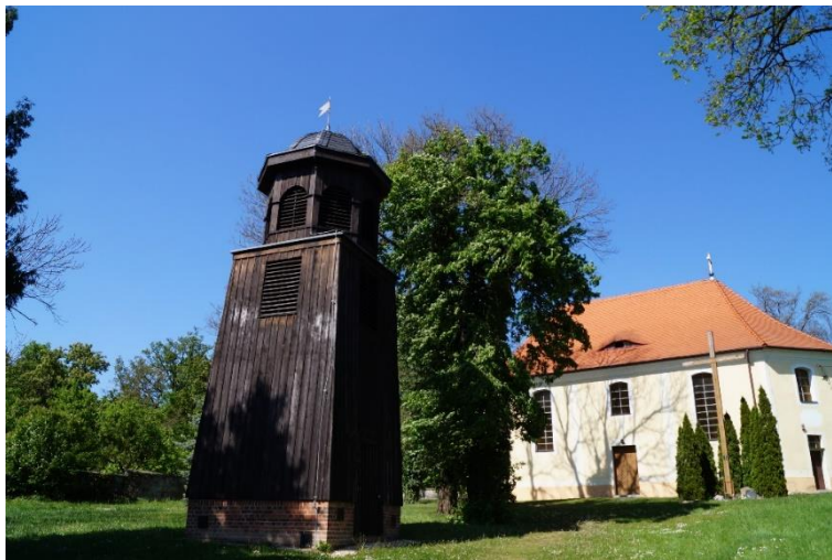
Czerniec, dzwonnica w zespole rzymskokatolickiego kościoła filialnego pw. Matki Bożej Wspomożenia Wiernych, stan obecny – maj 2024 r.

Dzwonnica w zespole kościoła pw. św. Michała Archaniola w Siedlcach, powstała zapewne ok. 1780 roku. W obecnym stanie wymaga przeprowadzenia prac remontowo-konserwatorskich. Już w roku 2018 r. opracowana została dokumentacja projektowo-kosztorysowa remontu. Remont przewidziany jest na rok 2024, współfinansowany będzie z budżetu Gminy Lubin.