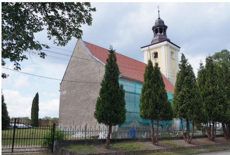
Rzymskokatolicki kościół parafialny pw. św. Katarzyny w Gogołowicach, z odbudowanym historycznym hełmem wieży, w trakcie remontu elewacji korpusu, stan obecny – maj 2024 r.

Obiekty sakralne Gminy Lubin użytkowane są zgodnie ze swym pierwotnym przeznaczeniem i zachowane w dobrym stanie. Systematycznie prowadzone są przy nich prace remontowe i konserwatorskie. Rokrocznie z budżetu Gminy Lubin udzielane są dotacje na prace konserwatorskie, restauratorskie i roboty budowlane przy zabytkowych obiektach sakralnych. W ostatnich latach, z udziałem finansowym Gminy, zrealizowano odbudowę historycznych hełmów wież kościołów Gogołowicach i Oborze oraz przeprowadzono remont hełmu wieży kościoła w Miłoradzicach. Odbudowa historycznych hełmów wież kościelnych, stanowiących dominanty wysokościowe miejscowości, znacząco wzbogaca układ przestrzenny miejscowości, przywracając jego historyczną sylwetę.